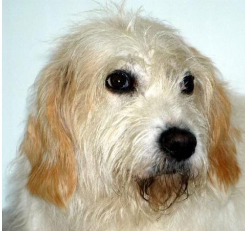
Afbeelding: Raad van Beheer