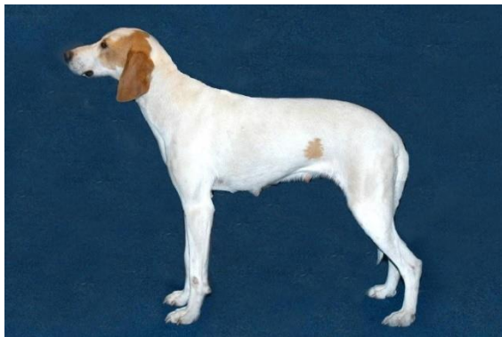
Afbeelding: Raad van Beheer