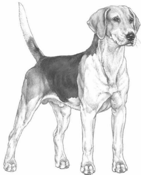
Afb. FCI Rasstandaard