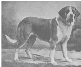
Graaf van Bylandt 1904